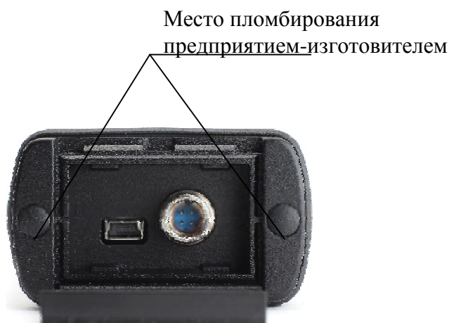
Рисунок 2 – Схема пломбировки от несанкционированного доступа